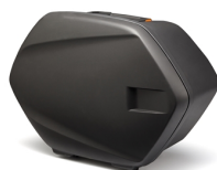
Lijevi bočni spremnik od 20 l za duga putovanja