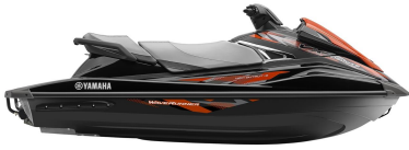
Black Metallic with Lava