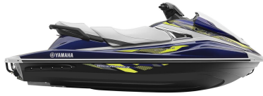
Yacht Blue Metallic