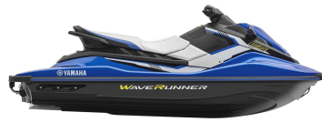
Azure Blue Metallic