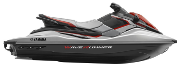
Silver Metallic with Torch Red Metallic